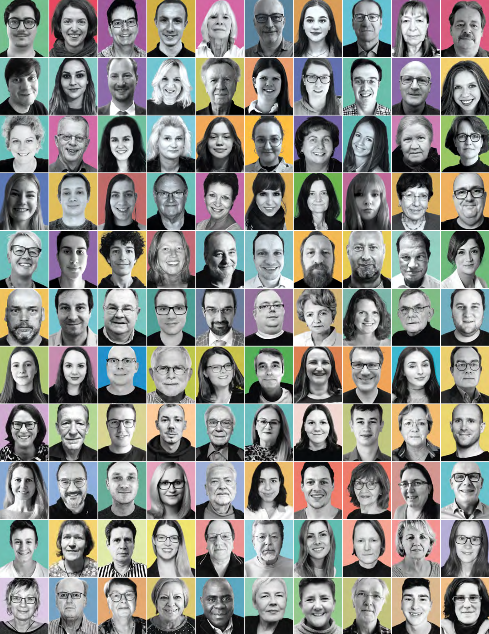
Les participants et participantes à la Convention Citoyenne ont été invité.e.s à envoyer des photos. La plupart d'entre elles et eux ont participé. Deux photographes ont édité les photos et cette galerie a été créée.